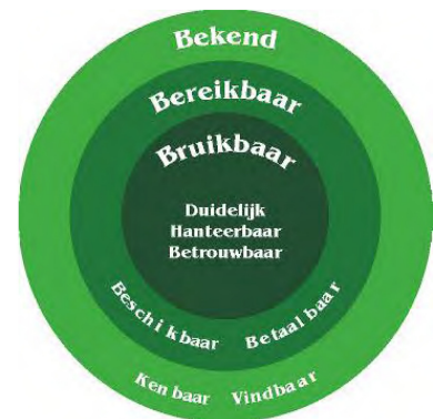
Model van Backx afgebeeld als concentrische schillen

Voor het beschrijven en ordenen van de belangrijkste belemmeringen voor gebruik van open geodata redeneert het doorbraakteam vanuit een gebruikersperspectief. Hiermee sluit het aan op het schillenmodel van Backx (2003)*. Backx stelt dat een gebruiker door een aantal barrières moet om te komen tot gebruik van data. Deze barrières kunnen worden benoemd als ' bekendheid ' (kenbaar en vindbaar), ' bereikbaarheid ' (beschikbaar en betaalbaar) en ' bruikbaarheid ' (duidelijk, hanteerbaar en betrouwbaar). Daarnaast is de governance van de data van belang. Dit heeft betrekking op aspecten als beheer van de data, een aanspreekpunt voor de data enzovoorts.